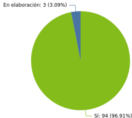
Gráfico 153: Porcentaje de CPR según la existencia de un Reglamento de Organización y Funcionamiento