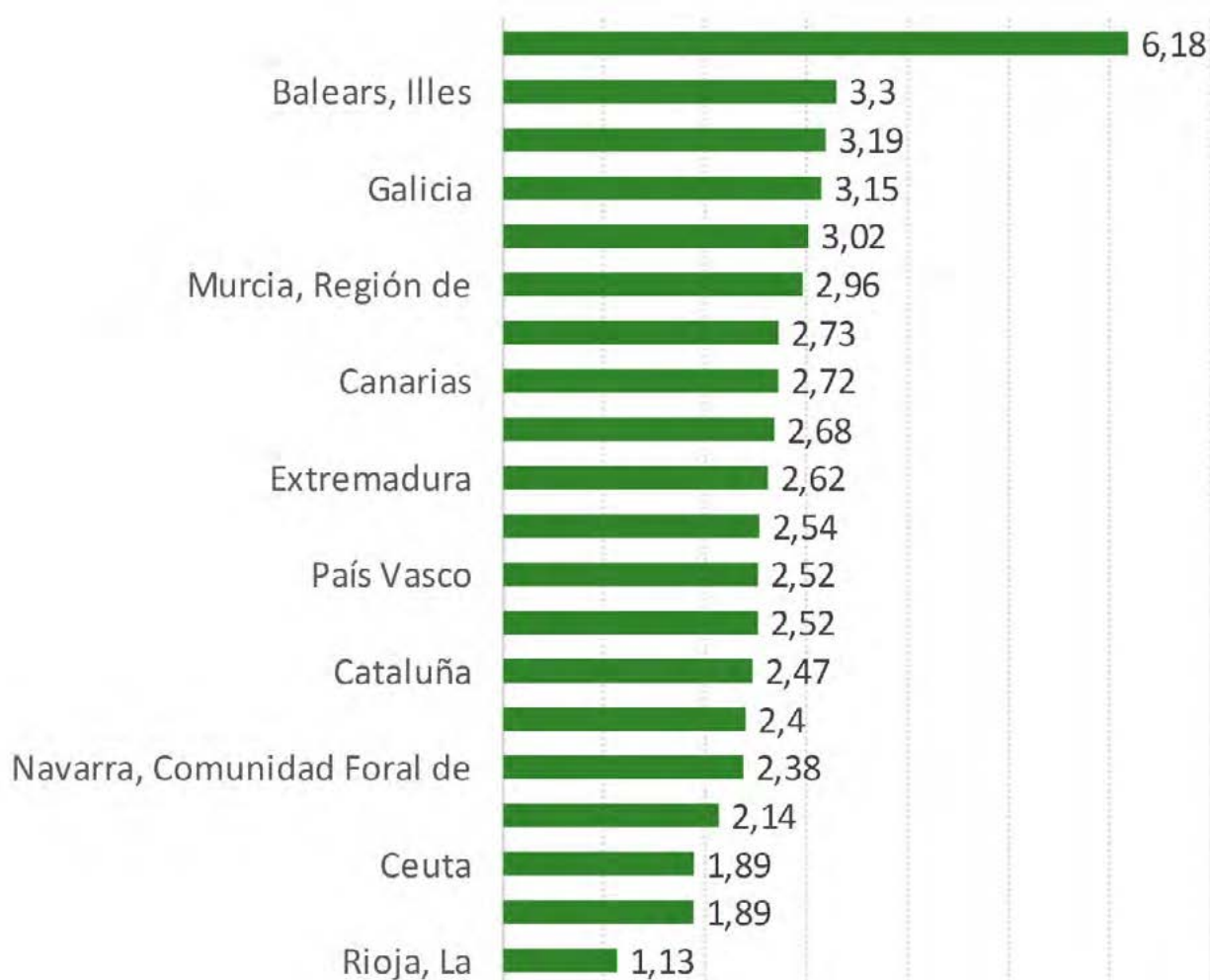
Gráfico 8. Tasa de mortalidad infantil según comunidad autónoma. España, 2016