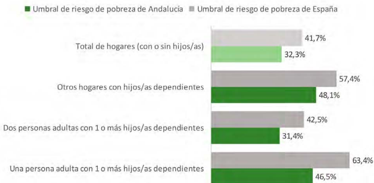
Gráfico 16. Tasa de riesgo de pobreza o exclusión social (tasa AROPE) según tipo de hogar. Andalucía, 2016